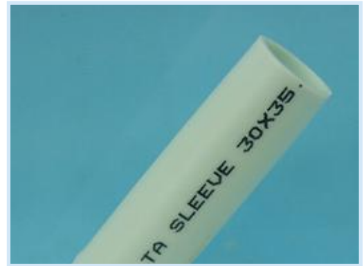
Standardoberfläche ist Glatt/Stumpf

Hinweis: Wenden Sie sich für weitere Fragen zu den Details, wegen Abmessungen und Verfügbarkeit, an Ihren Händler vor Ort.