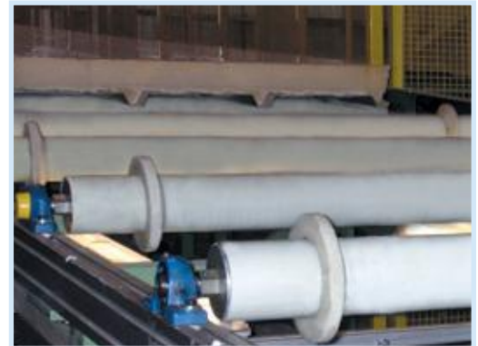
Eine abriebfeste Oberfläche schützt die Produkte